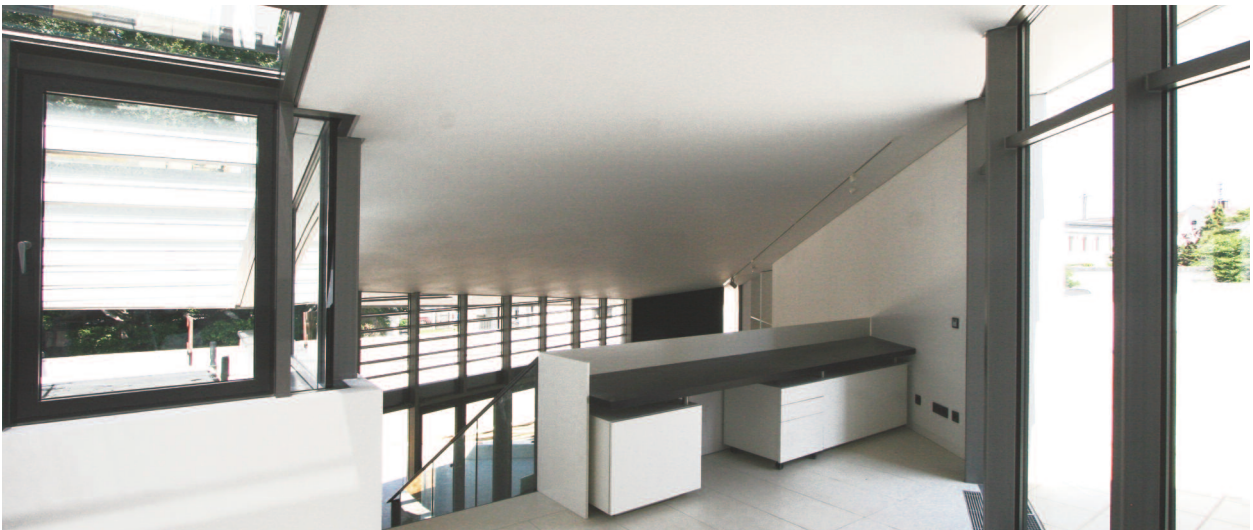
innen wohn- und essräume